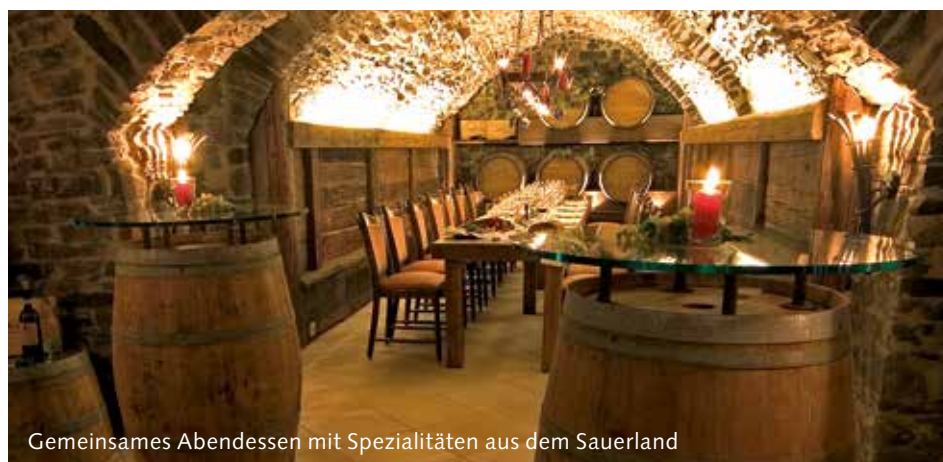
Gemeinsames Abendessen mit Spezialitäten aus dem Sauerland

Wir möchten Ihnen mit unseren Seminaren nicht nur Wissen vermitteln, sondern uns auch als gute Gastgeber präsentieren. Deshalb bereiten wir für Sie ein abendliches Rahmenprogramm vor. Es gibt hier verschiedene Wahlmöglichkeiten – freuen Sie sich z. B. auf: