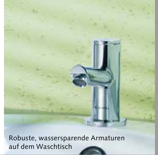
Robuste, wassersparende Armaturen auf dem Waschtisch

Aus der Praxis für die Praxis Alle SCHELL Seminare verfolgen das Ziel, Ihnen fundiertes Wissen zu vermitteln, das Sie bei Ihrer täglichen Arbeit gut nutzen können. Zudem erhalten Sie Argumente und Hilfsmittel für die zielgruppengerichtete Vermarktung hochwertiger Sanitärtechnologien und -produkte. Der problemlose Umgang mit neuen Technologien ist ebenso Thema der Seminare wie die Anforderungen von neuen Normen und Richtlinien. Alle Inhalte bauen auf dem aktuellen Stand der Technik auf und sind sehr praxisnah. Gerne gehen wir auch auf spezielle, für Sie wichtige Themenbereiche ein: Da sind wir flexibel.