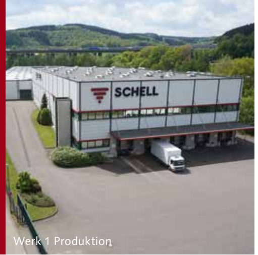
Werk 1 Produktion