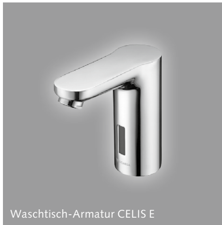
Waschtisch-Armatur CELIS E

Als zuverlässiger Partner des Sanitärhandwerks blickt SCHELL auf eine mehr als 80-jährige Erfahrung in der Konstruktion und Fertigung von praxisingerechten Sanitärarmaturen zurück. Neben kontinuierlicher Innovation und höchsten Qualitätsansprüchen verdanken wir unseren Erfolg einer ausgeprägten Markenphilosophie und einer engen Zusammenarbeit mit dem Handel und dem Handwerk, mit Planern und Anwendern.