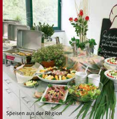
Speisen aus der Region