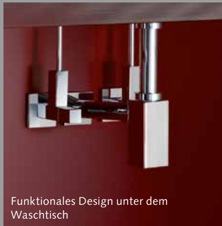
Funktionales Design unter dem Waschtisch

Aus der Praxis für die Praxis Alle SCHELL Seminare verfolgen das Ziel, Ihnen fundiertes Wissen zu vermitteln, das Sie bei Ihrer täglichen Arbeit gut nutzen können. Zudem erhalten Sie Argumente und Hilfsmittel für die zielgruppengerichtete Vermarktung hochwertiger Sanitärtechnologien und -produkte. Der problemlose Umgang mit neuen Technologien ist ebenso Thema der Seminare wie die Anforderungen von neuen Normen und Richtlinien. Alle Inhalte bauen auf dem aktuellen Stand der Technik auf und sind sehr praxisnah. Gerne gehen wir auch auf spezielle, für Sie wichtige Themenbereiche ein: Da sind wir flexibel.