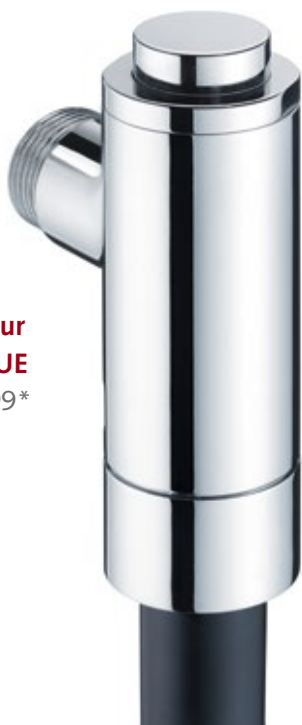
SCHELL WC- Vorwand-Spülarmatur SCHELLOMAT VALUE Art. Nr.: 02 254 06 99*

Nur im internationalen Geschäft erhältlich!