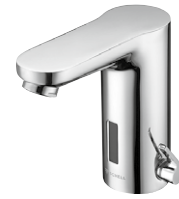
Elektronische Waschtisch-Armatur CELIS E