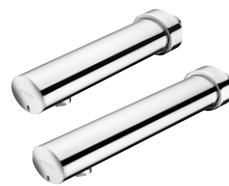
Elektronische Aufputz-Waschtisch-Armatur MODUS E