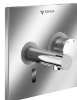
Elektronische Unterputz-Waschtisch-Armatur LINUS W-E