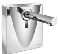
Elektronische Waschtisch-Armatur WALIS E