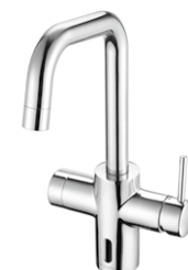
Elektronische Küchen-Armatur GRANDIS E