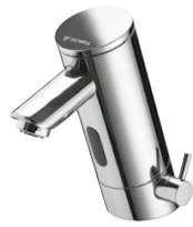
Elektronische Waschtisch-Armatur PURIS E