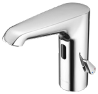
Elektronische Waschtisch-Armatur XERIS E

SCHELL Armaturen für Nutzerhygiene in Sozialräumen und Sanitär-bereichen der Lebensmittelproduktion und Gastronomie.