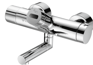
Elektronische Aufputz-Waschtisch-Armatur VITUS VW-E-T