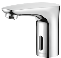
Elektronische Waschtisch-Armatur MODUS E