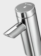
Zelfsluitende kraan PURIS SC