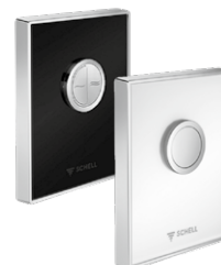
WC-bedieningsplaten AMBITION / AMBITION Eco