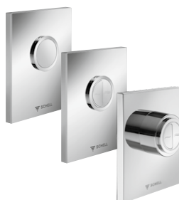
WC-bedieningsplaten EDITION / EDITION Eco