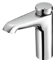
XERIS SC HD-K / HD-M mid.