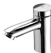
PETIT SC HD-K / HD-M