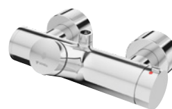
VITUS VD-SC-T boven/onder