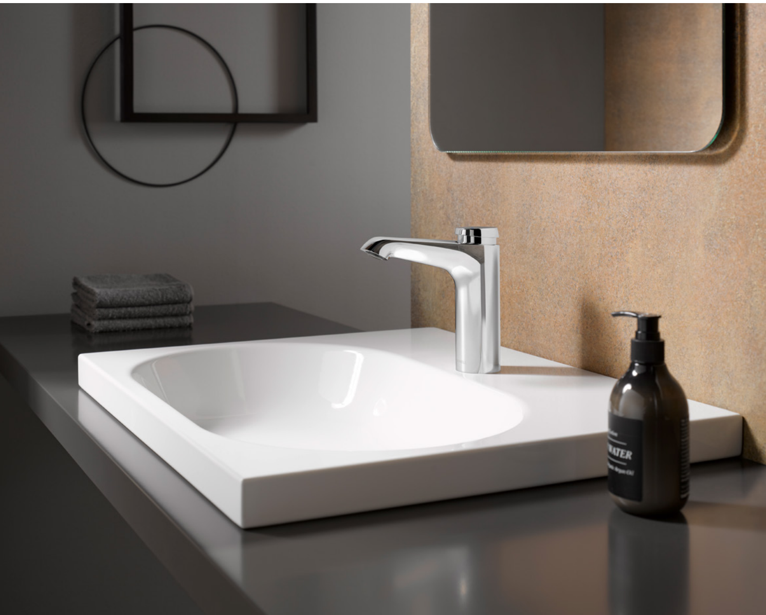
XERIS SC mid.

De aantrekkelijke, moderne vormgeving is kenmerkend voor alle zelfsluitende wastafelkranen van SCHELL. Bovendien dragen ze bij aan een betere gebruikershygiëne, omdat ze na het handenwassen niet meer hoeven te worden aangeraakt – een echte win-winsituatie.