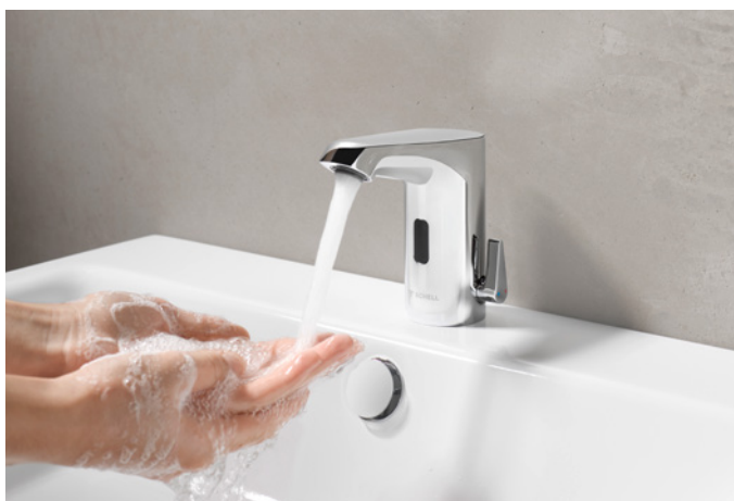
Bij elektronische SCHELL-kranen kunnen stagnatiespoelingen geprogrammeerd worden en zo helpen om de drinkwaterhygiëne te behouden.

Met het SCHELL-watermanagementsysteem SWS worden alle elektronische SCHELL-kranen in een gebouw centraal gekoppeld, bewaakt en aangestuurd. Zo ontstaat een efficiënt systeem voor optimalisatie, analyse en documentatie. Met SMART.SWS kan dit zelfs wereldwijd en volledig op afstand.