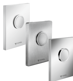
Bedieningsplaten urinoir EDITION