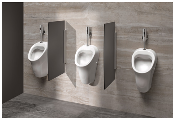
Bij elektronische urinoirkranen van SCHELL kunnen spoelhoeveelheden met programma's ingesteld worden, bijv. tijdens de pauze van een wedstrijd in stadions.