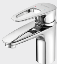
Eengreepsmengkraan MODUS EH

op een dag en 220 gebruiksdagen per jaar bij 38°C, evenals waterkosten van 4,5€ per m 3 en een gasprijs van 20 cent/kWh.