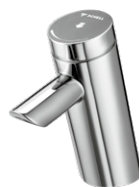
PURIS SC HD-K / HD-M