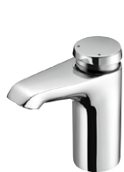
XERIS SC HD-K / HD-M small