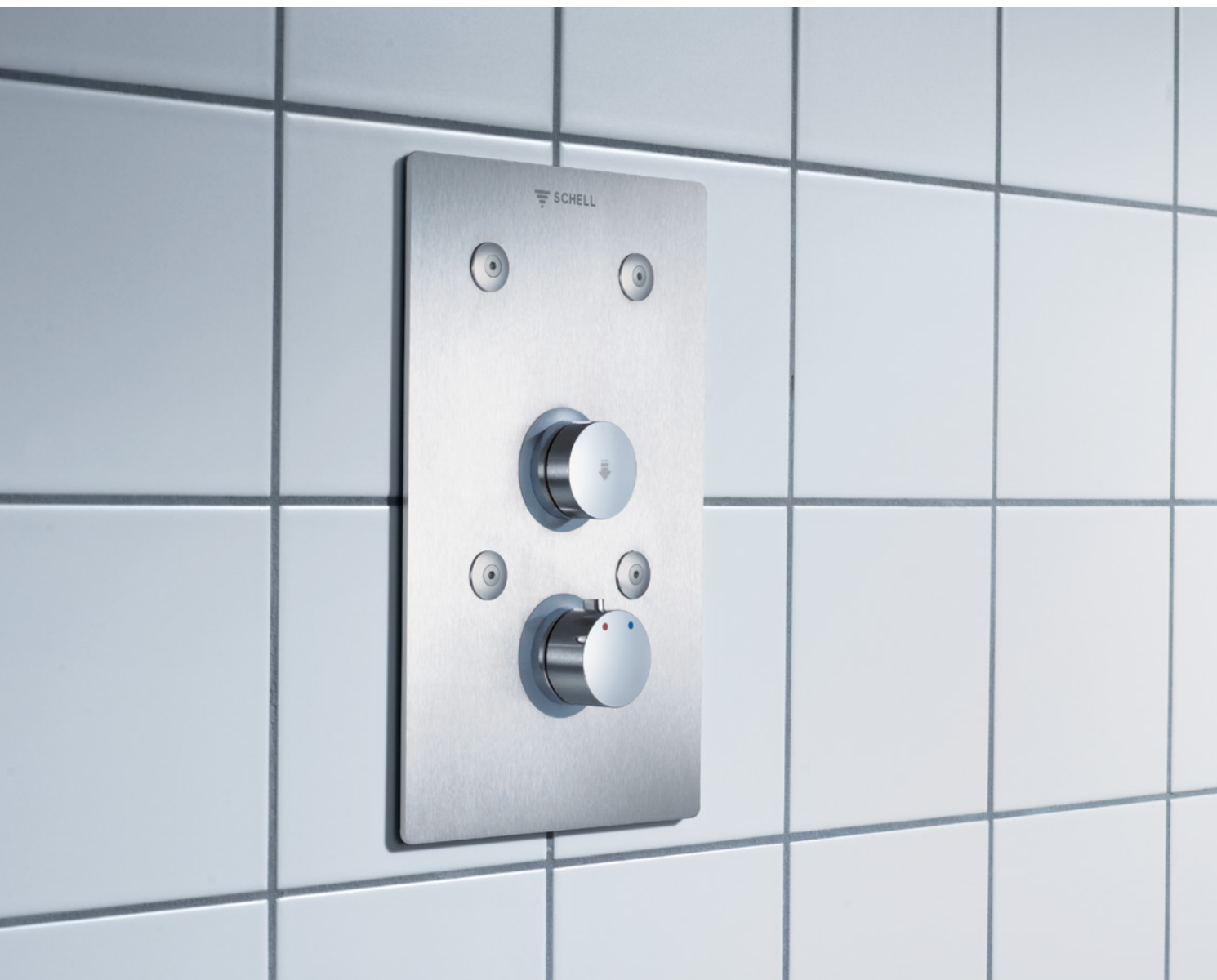
LINUS Basic D-SC-T

De robuuste en betrouwbare instapoplossing voor inbouwdouches