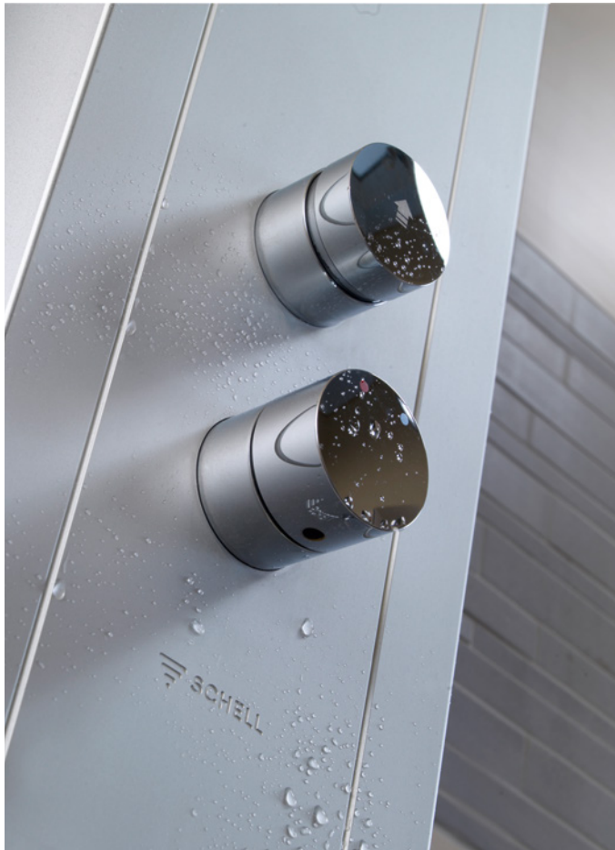
Duurzaam en tijdloos: opbouw- en inbouwdouchekranen van SCHELL.