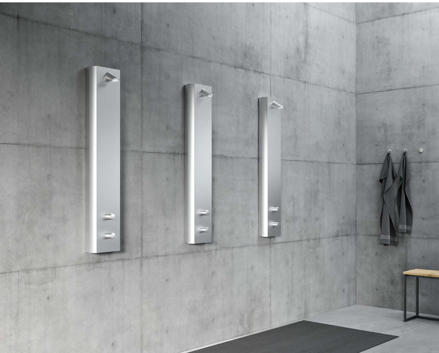
LINUS Inox DP-SC-T

Eenvoudig te monteren serie in twee favoriete uitvoeringen