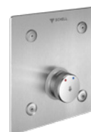
LINUS Basic D-SC-M