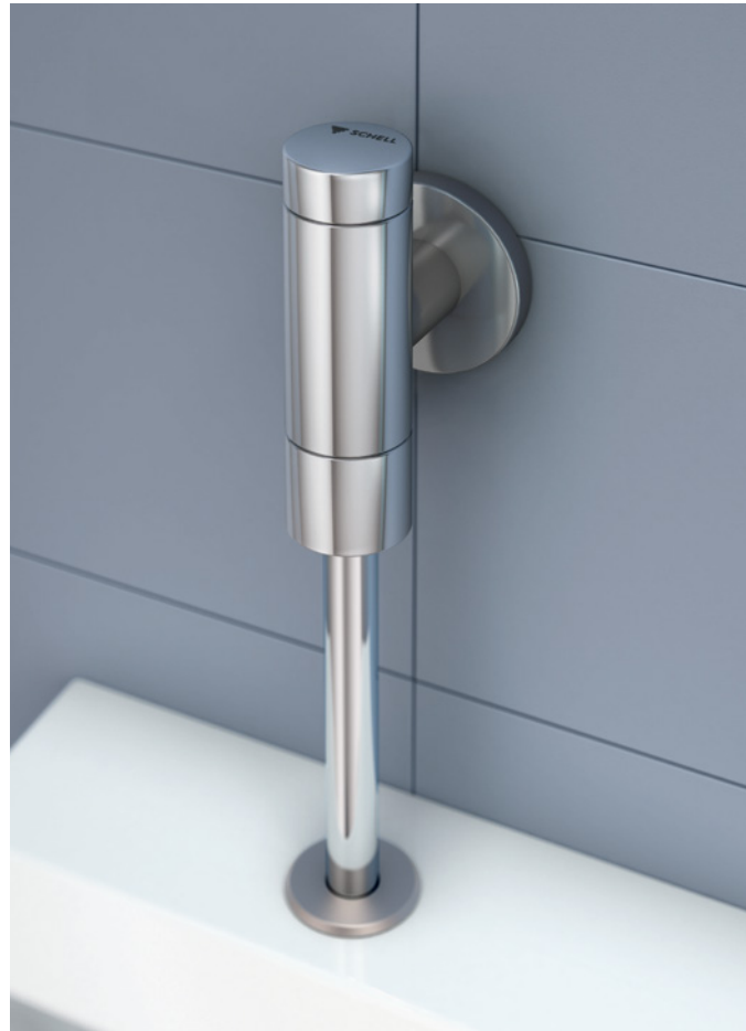
Degelijke klassieker in de sanitaire ruimte: SCHELLOMAT van SCHELL.