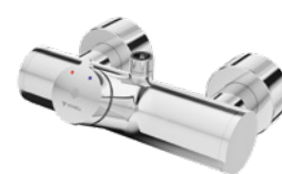
VITUS VD-SC-M boven/onder