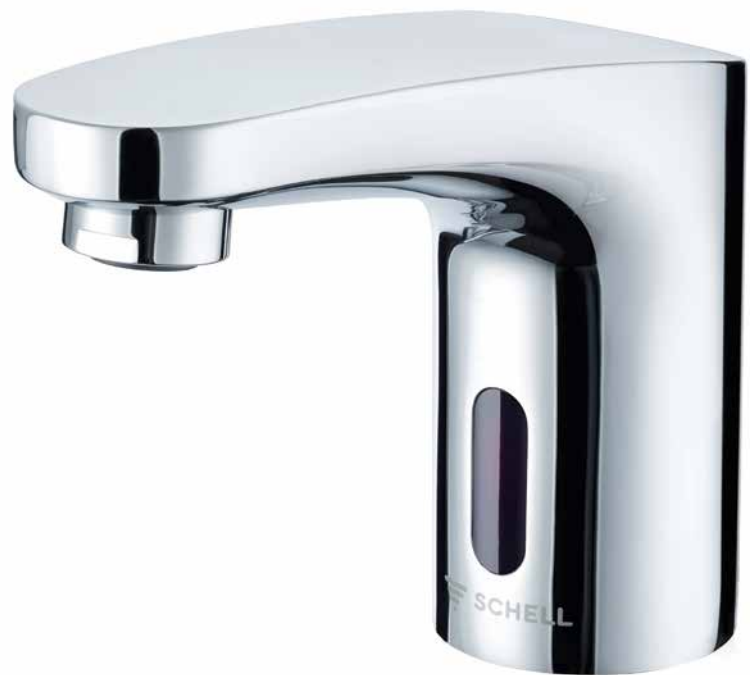
MODUS Trend E, un agua