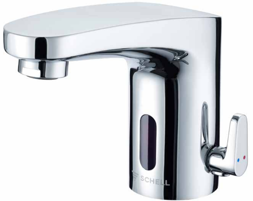
MODUS Trend E, mezclador