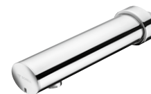
MODUS E z wylewką ścienną