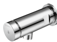
PETIT SC z wylewką ścienną