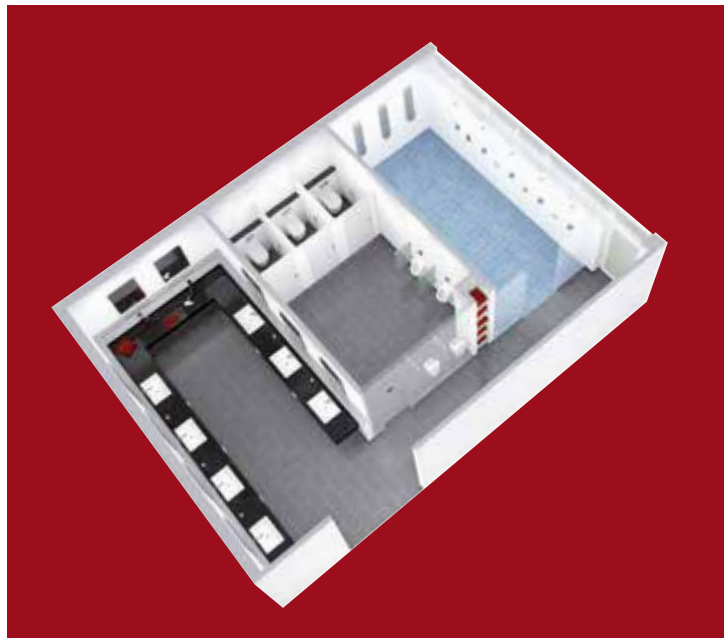
Tutta la rubinetteria per locali igienico-sanitari pubblici, semi-pubblici e commerciali