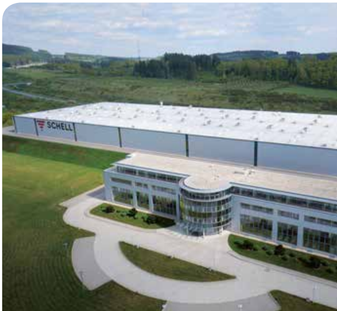
Stabilimento 1: Produzione con edificio amministrativo e centro di formazione